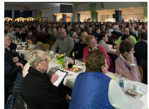
Über 1.000 Gäste zu Besuch bei der RWM im Bürgerhaus in Anröchte