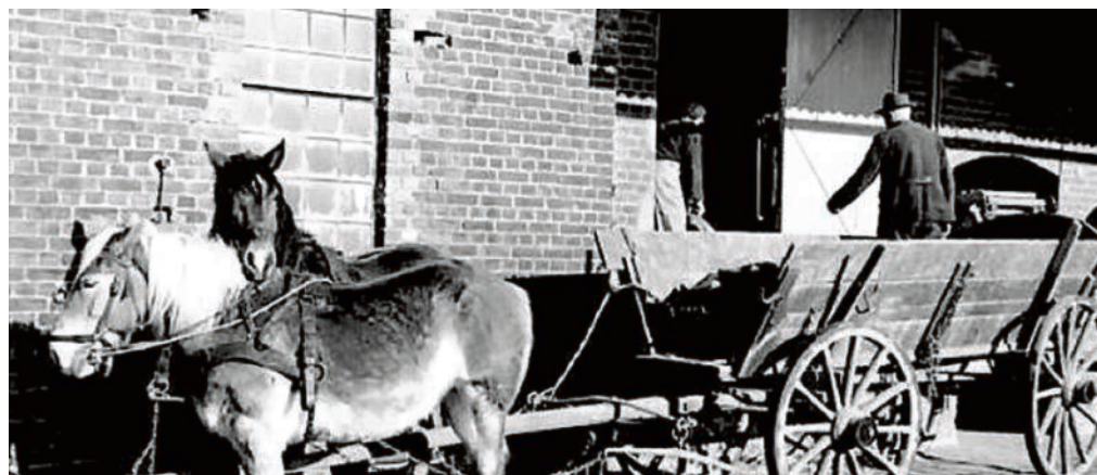
Mit der Kutsche zum Kornhaus Soest: Eine historische Aufnahme aus dem Jahr 1959.

Als heimische Landwirte die Westfälische Kornverkaufsgenossenschaft Soest gründeten, da wurde auf den Feldern noch mit einfachsten Geräten gearbeitet, über die Kopfsteinpflaster klapperten Pferdekutschen und es herrschte Wilhelm II. Auf die eigene 125-jährige Geschichte mit der Kornhaus-Gründung in Soest als Keimzelle haben die heutigen Genossen jetzt bei einem Festakt in Geseke zurückgeschaut.