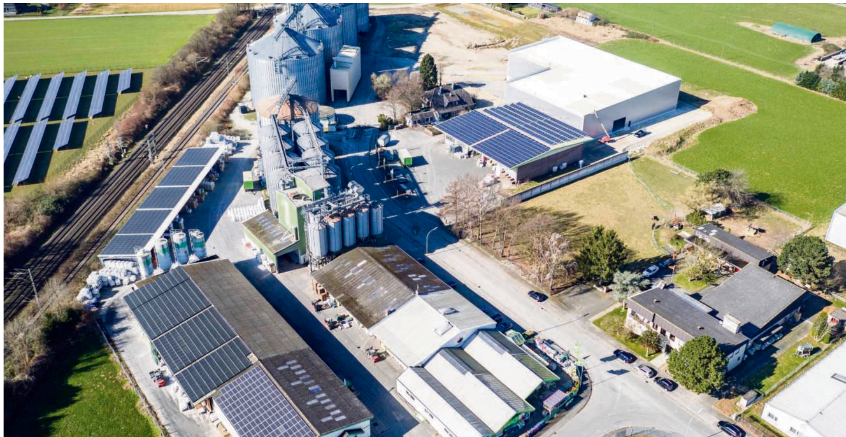
Getreidesilos, Lager, Raiffeisenmarkt – und ganz rechts das neue Logistikzentrum, die gewissermaßen multifunktional ist: In Geseke als größtem RWM-Standort fanden am vergangenen Samstag die Generalversammlung, Festakt und Party zum 125-jährigen Jubiläum statt.